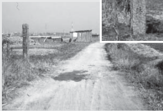
四馬塚の一里塚 (昭和 50 年)

ちはら 中川が星田の旧集落を出た左岸、神出来の東側を千原と言い、「茅原」と記されているものもあります。 千原