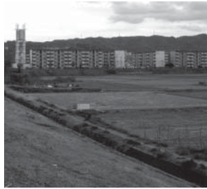
乙辺 (平成 11 年)

おつべ 現在の乙辺浄化センターの辺り て辺 です。今は「おつべ」と言います。しかし、江戸時代の絵図には「乙の辺」あるいは「落野辺」と記載されているので、「おつべ、かおちのべ」と発音していたことが分かります。中川が天野川に合流する地点にあり、この地形の一番低い場所となっていることから「落野辺」となったのかもしれませんが。