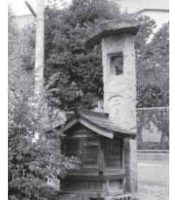
交野小学校の正門近くに建つ祠(手前)と、二月堂と刻まれた伏拝神(奥)

現在も交野小学校の正門近くに、明治40年ごろに作られた伏拝神と小さな祠を見ることができます。