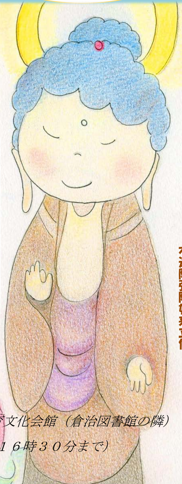
木造阿弥陀如来立像